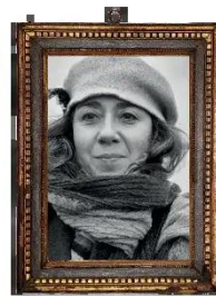
Luciana von Luciana