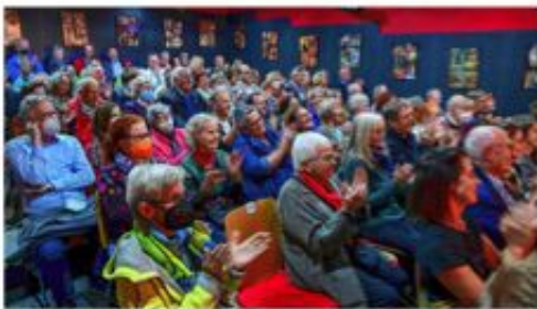
Die Premiere des Theater am Turm hat viel Zuschauer. Die Premiere des 50-jährigen Jubiläumsspektakels „Fifty-Fifty“ am Samstag, 22. September, ab 20 Uhr im Theater am Turm.

Villinger Schwanengesang. Ein Kabarettabend, der sich die 50-jährige Geschichte des Theater am Turm zum Anlass nimmt. Die Premiere des 50-jährigen Jubiläumsspektakels „Fifty-Fifty“ am Samstag, 22. September, ab 20 Uhr im Theater am Turm.