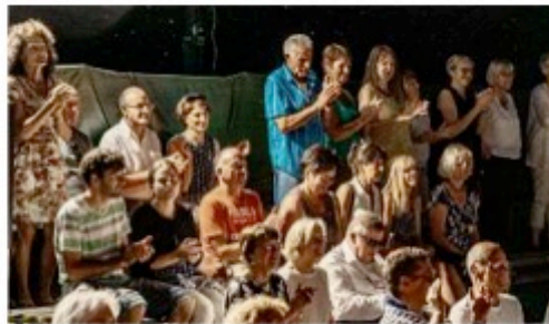
Das Publikum bei der Premiere ist begeistert und spart nicht mit Applaus.